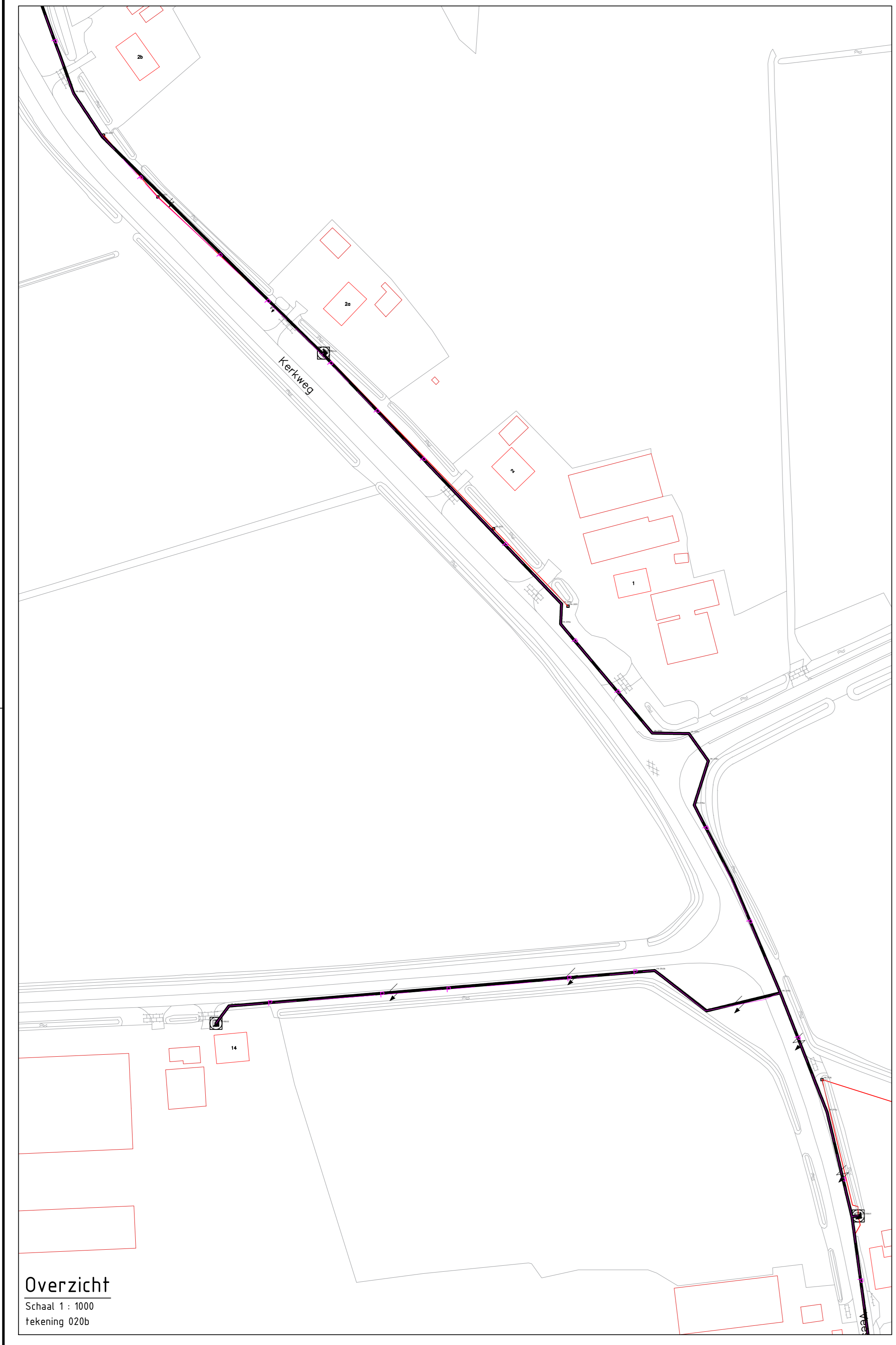
Overzicht Schaal 1 : 1000 Tekening 020b