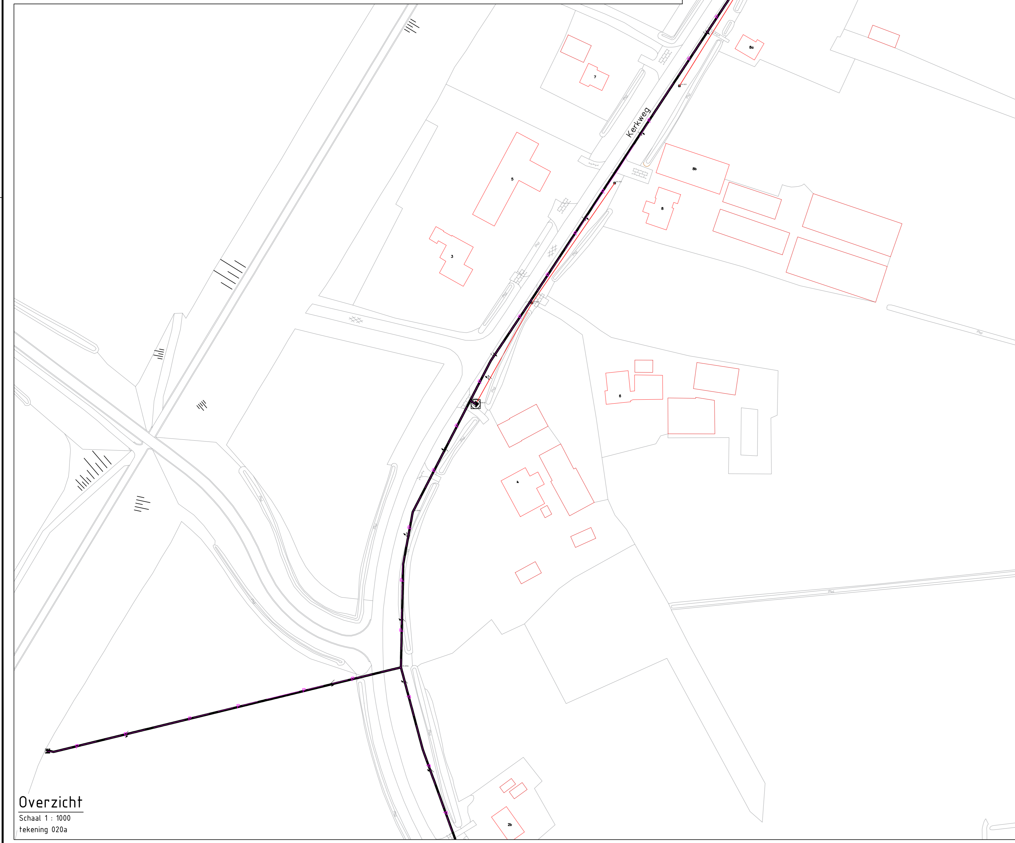
Overzicht Schaal 1 : 1000 Tekening 020a