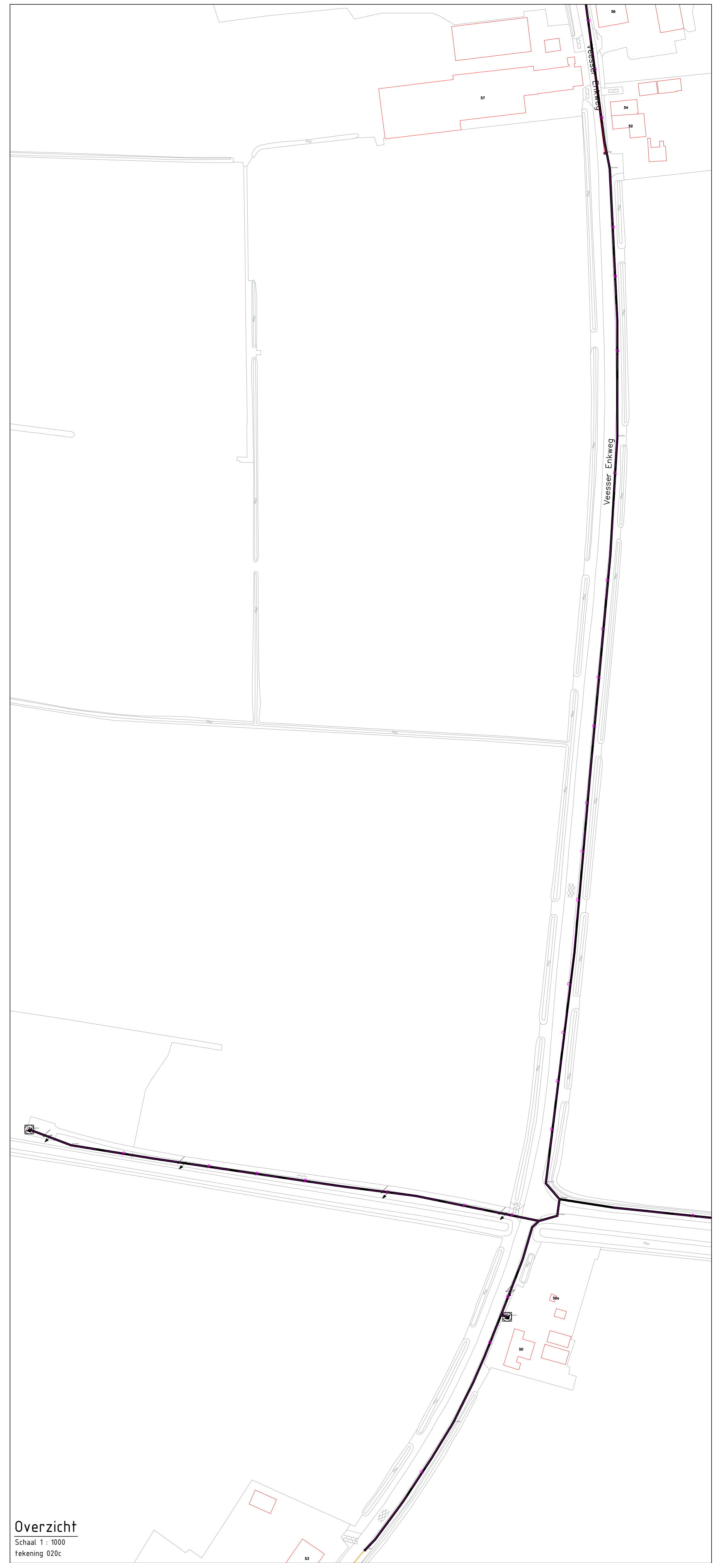
Overzicht Schaal 1 : 1000 Tekening 020c